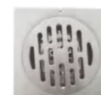
LD 10259 地漏