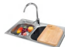
LD-TC99216 不锈钢水槽 748x428x195mm