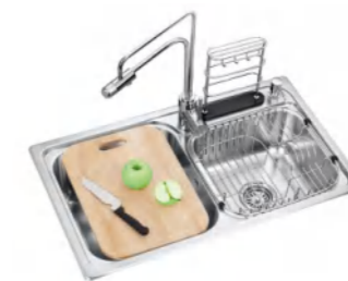
LD99108A 不锈钢水槽 820x480x220mm