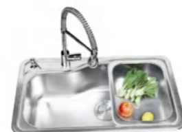
LD99117A 不锈钢水槽 830x490x230mm