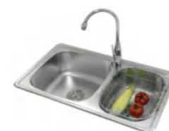
LD99238 不锈钢水槽 780x450x200mm