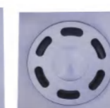
QLD 10278A 地漏