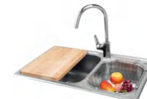
LD-TC99210 不锈钢水槽 815x470x200mm