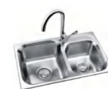
LD99600A 不锈钢水槽 750x470x230mm