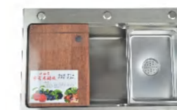
LD-99296-3S 不锈钢水槽 750x460x218mm