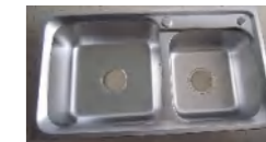
LD99226 不锈钢水槽 780x430x210mm