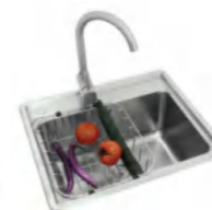
LD99239 不锈钢水槽 520x450x210mm