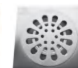
LD 11932 地漏