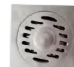
LD 10260 地漏