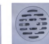
QLD 10279 地漏