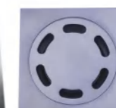
QLD 10278 地漏