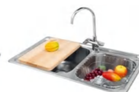
LD-TC99227 不锈钢水槽 850x460x200mm