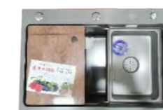
LD-99295-2S 不锈钢水槽 680x460x218mm