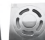
LD 11933 地漏